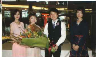
(グランドプリンスホテル広島)