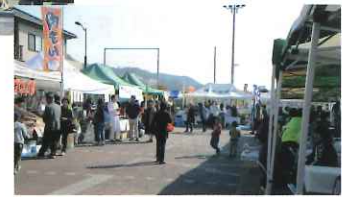
(府中市お祭り広場など)