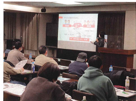
令和 5 年 1 月 22 日(日) 広島会場

※受講対象者には、10 月初め頃に開催案内、申込書を送付する予定です。 開催日の 15 日前まで申込みができます。