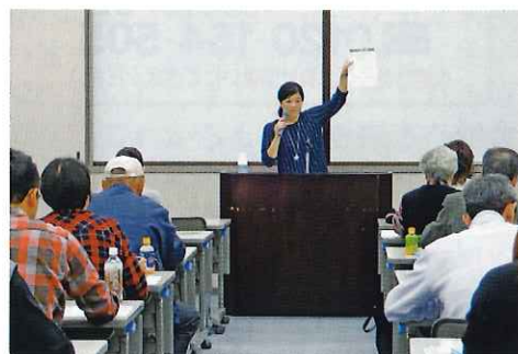
平成27年11月8日 福山会場