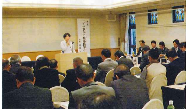
(27.11.9 ホテルサンルート広島)