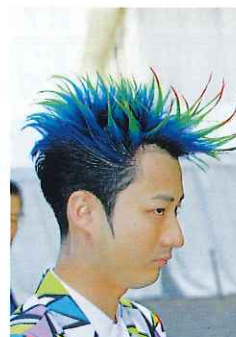
大きなプレッシャーの中で、冷静に集中して取組めます!!