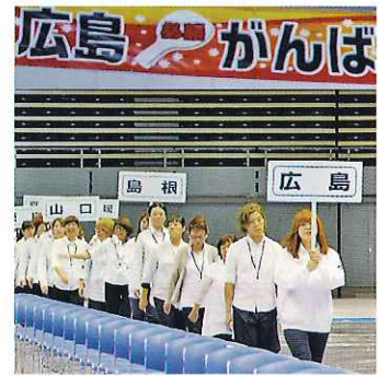
広島県応援団も多数かけつけ大きな声援を送りました。(27.10.20 北海道)