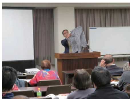
令和2年2月2日(日) 広島会場