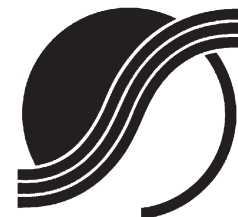
B A 広島