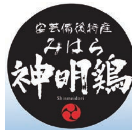
神明鶏PRロゴマーク