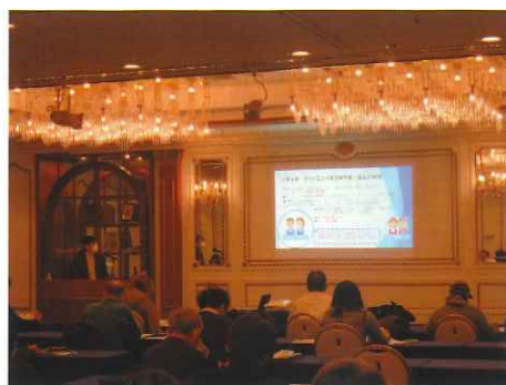
令和 3 年 1 月 31 日(日) 広島会場

※受講対象者には、10 月初め頃に開催案内、申込書を送付する予定です。 開催日の 15 日前まで申込みができます。